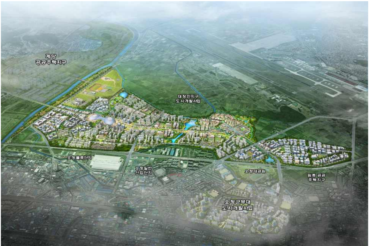
[지구지정 발표시, 2020. 5. 27.]