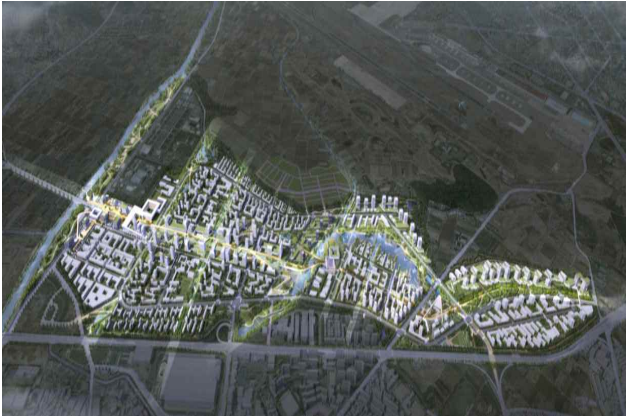
[기본구상 국제공모, 2020. 8. 31.]